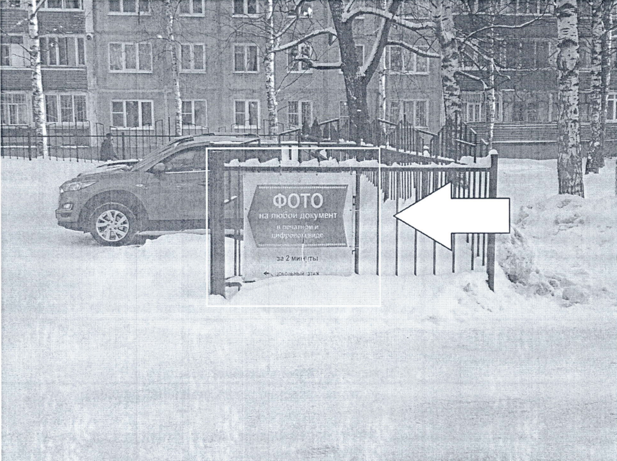
ФОТО на любой документ в печатном и цифровом виде за 2 минуты ← ДОКОНЬНЫЙ ЭТАЖ