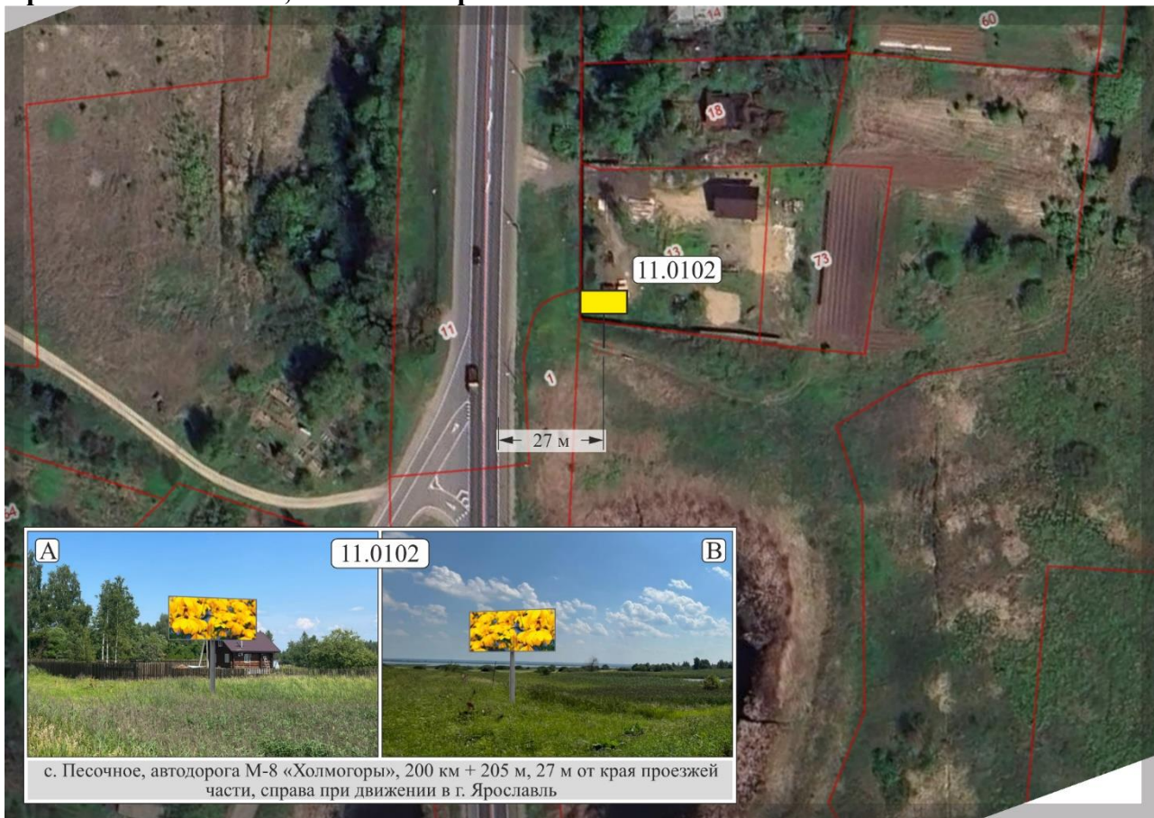
с. Песочное, автодорога М-8 «Холмогоры», 200 км + 205 м, 27 м от края проезжей части, справа при движении в г. Ярославль